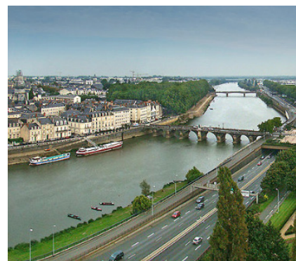
7 décembre 2017, Angers