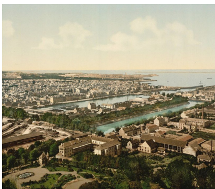
11 mai 2017, Cherbourg

un membre des équipes pluridisciplinaires (médecins du travail, infirmiers, IPRP, ASST...) administratives ou supports. Organisés en mode inter-régional, ils se tiennent quatre fois par an et se veulent des forums de discussion et d'échanges de pratiques entre Services, permettant aux participants des Ateliers du Cisme de repartir avec de nouvelles approches et méthodologies. Les supports de présentation et outils partagés par les SSTI orateurs sont ensuite mis à disposition sur le site du Cisme. A noter que les sujets sont choisis en fonction des besoins exprimés des adhérents : les SSTI sont donc invités à faire connaître leurs suggestions via l'adresse ateliers-ducisme@cisme.org. ■