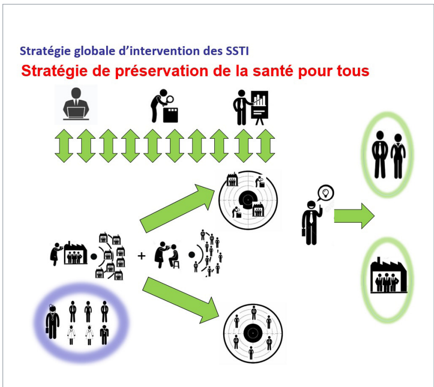
Schéma de synthèse de la stratégie globale d'intervention.

Les documents déjà disponibles peuvent être retrouvés dans le fil d'actualité, ainsi que sur la page "Notes et avis" du site Cisme.org.