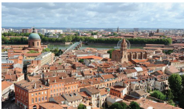
Toulouse, ville d'accueil de l'AG du Cisme 2014.

Tenue ces 24 et 25 avril à Toulouse, l'Assemblée générale du Cisme 2014 aura été l'occasion de revenir sur le bilan intermédiaire de la réforme, en présentant celui des Services comme celui de la Direction Générale du Travail, puis d'explorer quelques-unes des pistes d'évolution imaginables à la lecture de cet état de lieux.