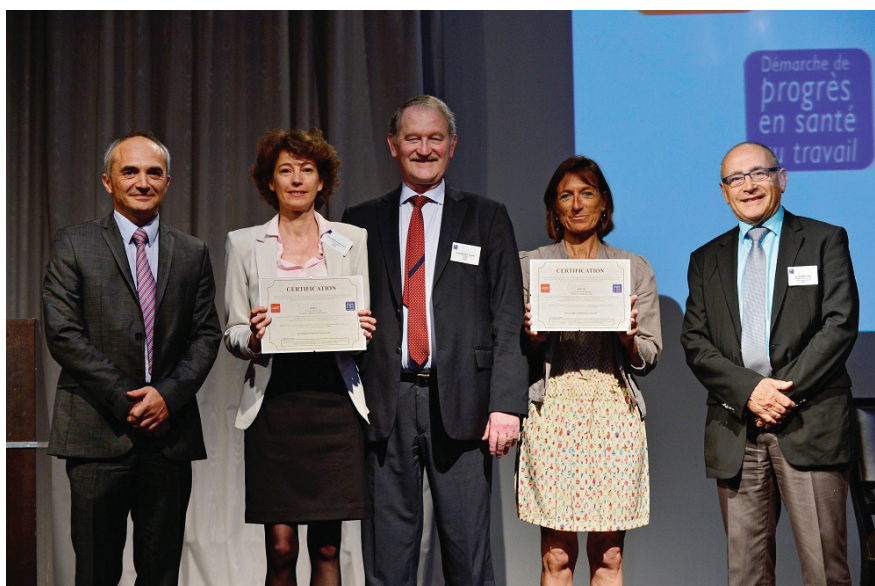
Remise des deux premières certifications Amexist aux Services GEST 05 et ASMIS.

Les différentes interventions de la journée d'étude comme de l'assemblée statutaire seront plus richement restituées dans le numéro des IM du mois de juin. ■